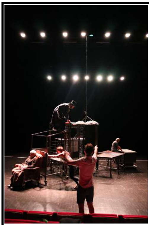
Les premiers essais en répétitions.

À cette scénographie tournant sur elle-même viendront se greffer des plateformes et structures à roulettes (symboles du puzzle que Lewis et Fanny Stevenson reconstitue à travers l'écriture), éléments autonomes pouvant se solidariser avec le premier bâtiment pour permettre au spectateur de voir ce dessiner un carrousel.