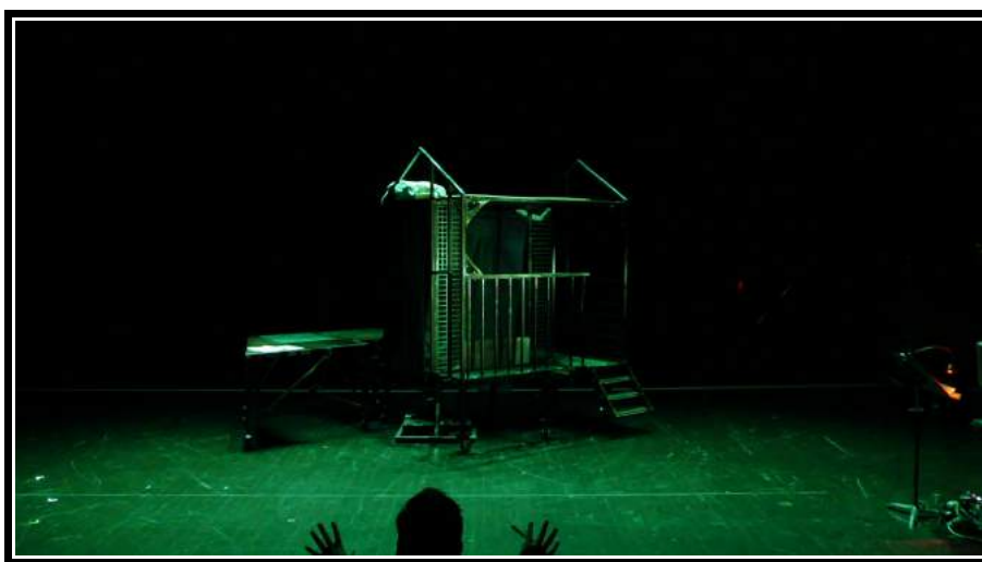
La maison de Robert Lewis Stevenson et Harry Jekyll dans « Dr Jekyll & le mystère Hyde »