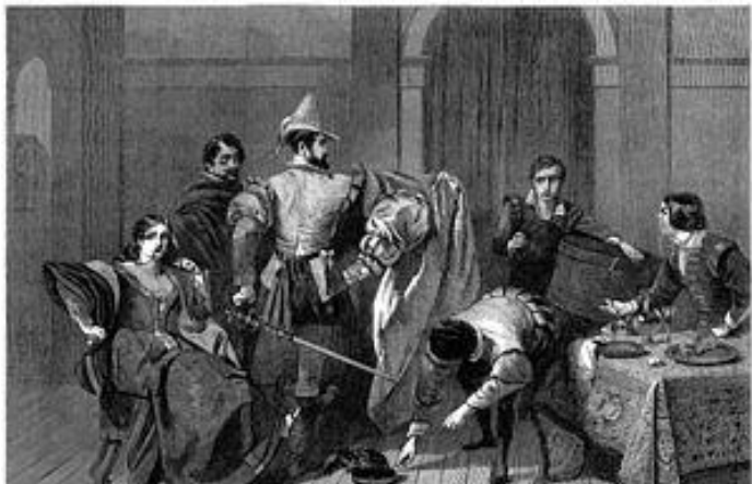
The Taming of the Shrew (La Mégère apprivoisée), by C. R. Leslie

Dans la mise en scène de Frédérique Laza- rini, l'histoire se noue autour d'un cinéma ambulante sur la place d'un village, dans les années 50 en Italie. L'intrigue se déroule sur la scène et à l'écran pour cette mise en abyme chère à Shakespeare, où chacun joue son rôle dans une vie qui a tout d'une fiction et d'un grand théâtre.