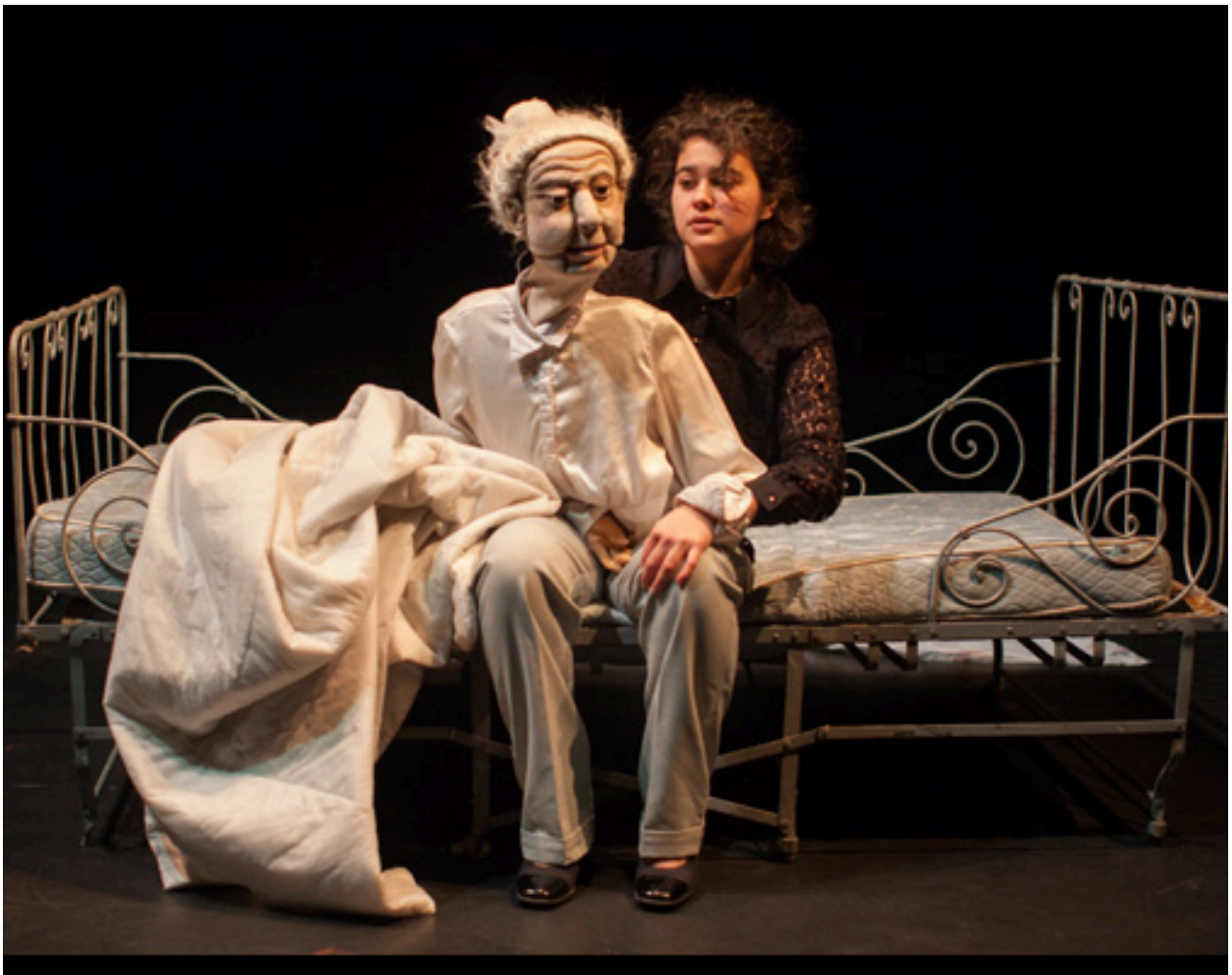
Inspiration de scénographie

Fabrication : tête en terre glaise et résine thermomodulable, corps en mousse.