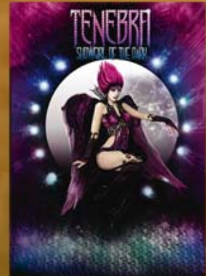
Ténébra, Showgirl of the Dark (2014)

C'est le 9 octobre 2005 que David Rozen crée le premier spectacle de la Communauté du Manoir, qui n'était pas destiné au jeune public au départ. Les spectateurs découvrent alors pour la première fois, dans "Pleine lune sur Big Manoir", les aventures de 4 candidats enfermés dans un manoir hanté, et guidés par Ténébra (qui deviendra plus tard Malicia dans la version pour enfants). Le succès est immédiat, et les épisodes s'enchaînent, avec "Big manoir, the Outragious Version" créé en janvier 2007 et "Big Manoir, la revanche de Nicole" qui voit le jour en juillet 2007.