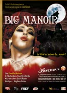
Big manoir, the Outragious Version (2007)