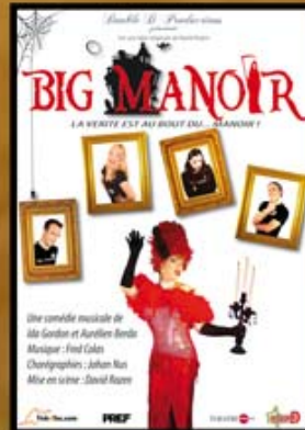
Big Manoir, la revanche de Nicole (2007)