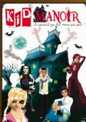
Kid Manoir (2008)

Aujourd'hui, avec "Kid Manoir 2", tous les fidèles des spectacles du Manoir vont découvrir une toute nouvelle aventure riche en rebondissements !