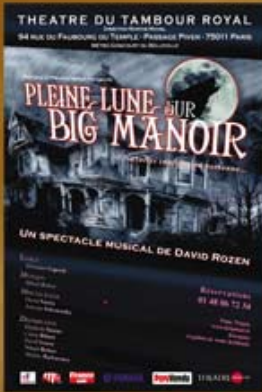
Pleine lune sur Big Manoir (2005)