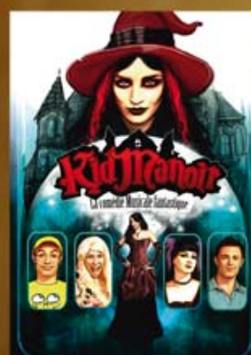
Kid Manoir 1 (2010)