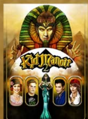
Kid Manoir 2 (2012)